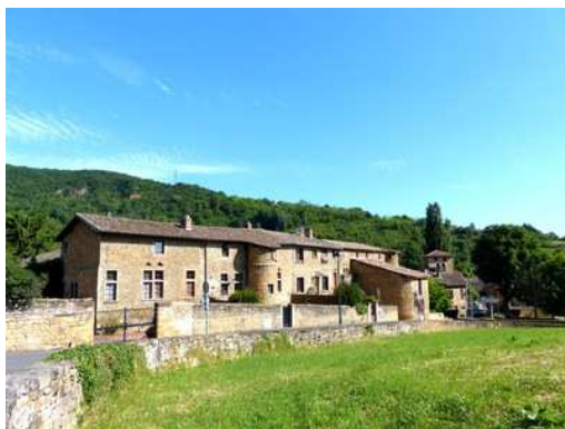
Château de la Bessée

Document conçu et mis en page en juin 2016 pour le Conseil Municipal des Enfants de Saint-Romain-au-Mont-d'Or, par Luc Bolevy, auteur du livre « Le Mont d'Or lyonnais, petit et grand patrimoine » aux Editions du Poutan – www.poutan.fr