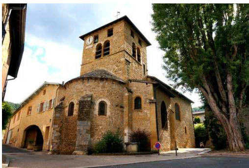
Eglise de Saint-Romain

Nous voici revenus à notre point de départ ! Ici se termine notre parcours. A bientôt !